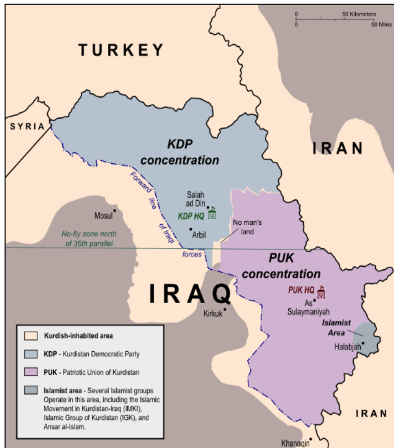
شکل ۱. نقشه تقسیم مناطق کردنشین عراق بین حزب دمکرات و اتحادیه میهنی در سال ۲۰۰۳