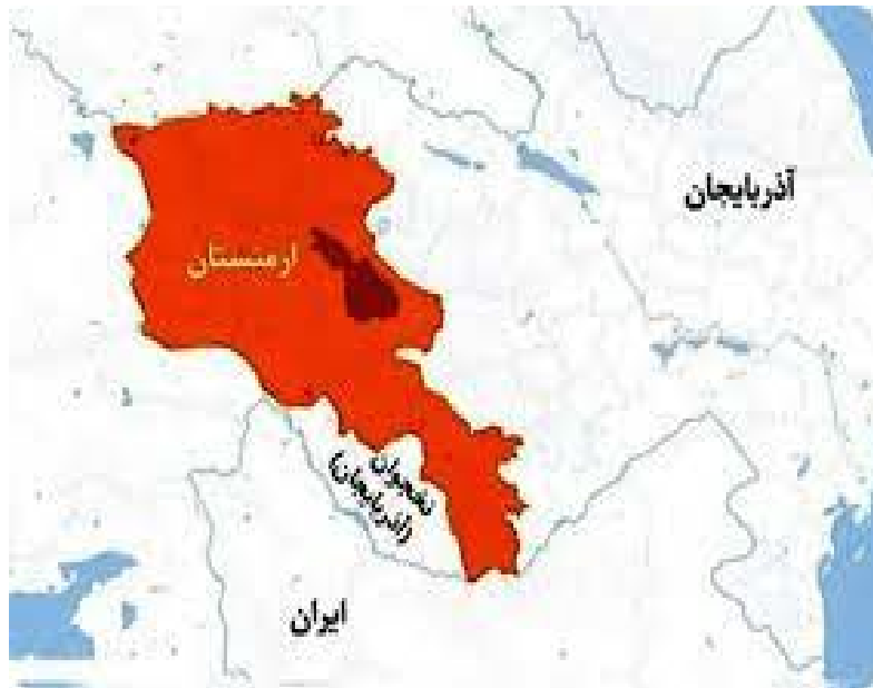
نقشه ۱. موقعیت جغرافیایی ارمنستان

با وسعتی برابر با ۲۹٬۸۰۰ کیلومتر مربع، ارمنستان کشوری کوهستانی در قلب فلات ارمنستان به‌شمار می‌رود که میانگین ارتفاع آن حدود ۱۸۰۰ متر از سطح دریاست. این ویژگی، هم در شکل‌گیری هویت ملی و هم در ساختار دفاعی کشور نقش ایفا کرده است. مرزهای آن با گرجستان در شمال، جمهوری آذربایجان در شرق، ایران در جنوب، منطقه خودمختار نخجوان در جنوب‌غرب و ترکیه در غرب تعریف شده‌اند. با این حال، بسته بودن مرزها از سوی ترکیه و جمهوری آذربایجان (نقشه شماره ۱) باعث شده ارمنستان در یک وضعیت انزوای ژئوپلیتیکی مزمن قرار گیرد که فرصت‌های تجاری و ترانزیتی آن را به‌شدت محدود کرده است.